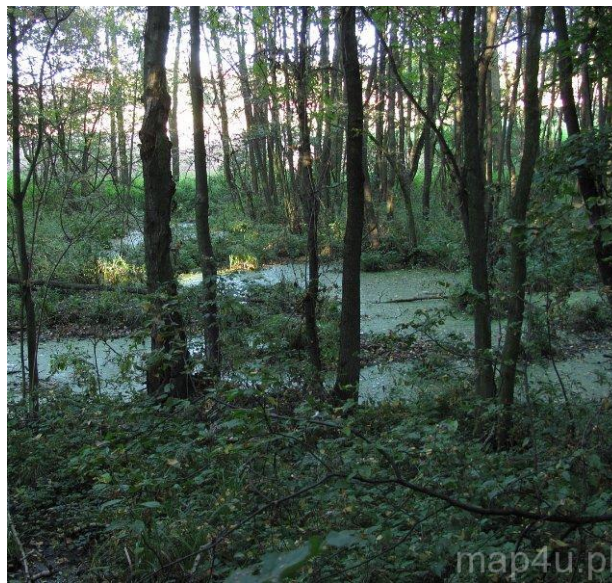
Ryc. 3 Zarastające zbiorniki wodne w granicach obszaru objętego planem