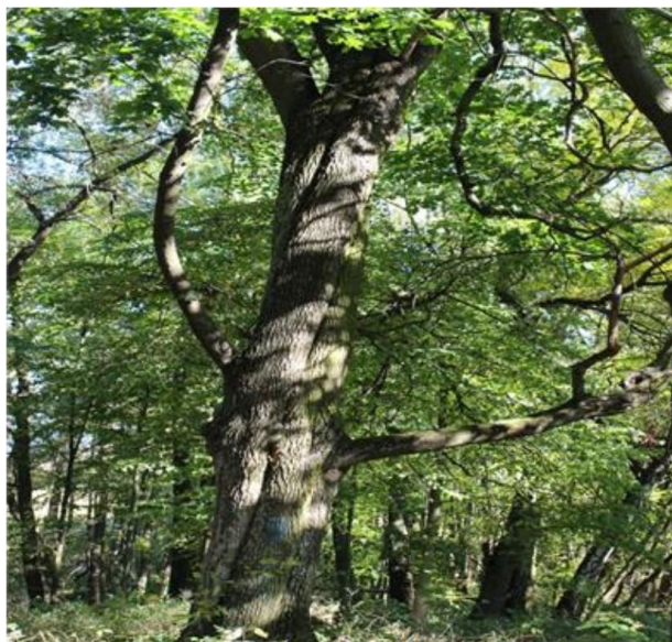
Ryc. 2 Pomnik przyrody – klon zwyczajny (nr 3 na obszarze opracowania)

Analizowany obszar całkowicie związany jest z zabytkowym parkiem dworskim i jego otoczeniem. Występuje tu duża ilość starodrzewia, którego największa koncentracja znajduje się w części południowej, w zasięgu granic zabytkowego parku. Znajdują się tu pomniki przyrody (dęby szypułkowe (1 zniszczony z rozpoczętą procedurą zniesienia statusu pomnika przyrody), lipa szerokolistna, jesion amerykański oraz klon zwyczajny). Na terenie parku występuje znaczna bioróżnorodność gatunkowa z przewagą gatunków rodzimych. Na terenie parku nie występuje warstwa podszytu w formie krzewów ozdobnych i rabat kwiatowych.