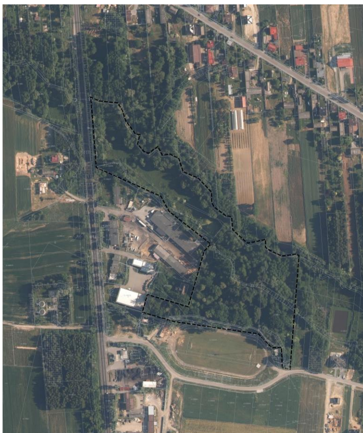
Ryc. 1 Ortofotomapa z naniesioną mapą zasadniczą i granicą obszaru objętego planem

Obszar objęty opracowaniem obejmuje w części fragment zabytkowego parku w zespole dworskim z początku XX w., we wsi Pątnów – ujętego w gminnej ewidencji zabytków, wraz z sąsiednimi terenami zielonymi. Położony jest w miejscowości Pątnów, w północnej części gminy Pątnów. Przebieg granicy obszaru objętego miejscowym planem ma charakter nieregularny i jest dostosowany do granic obszaru wpisanego do gminnej ewidencji zabytków oraz granic własności. Park w przeważającej części jest gęsto porośnięty roślinnością drzewiastą oraz runem. Tereny wolne od zadrzewień występuje w jego północno-zachodniej części. W granicach obszaru objętego projektem planu zlokalizowany jest również zarastający zbiornik wodny, a wzdłuż północnej granicy planu ciek – Dopływ z Popowic. W obszarze objętym opracowaniem występuje również 5 pomników przyrody, w tym 2 dęby szypułkowe (1 zniszczony z rozpoczętą procedurą zniesienia statusu pomnika przyrody), lipa szerokolistna, jesion amerykański oraz klon zwyczajny.