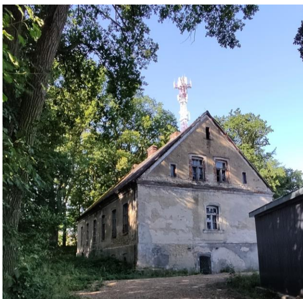
Ryc. 4 Zabytkowy dwór w Pątnowie